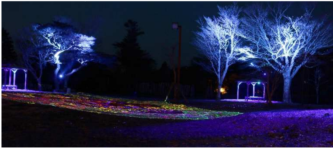
スカイガーデンのライトアップ